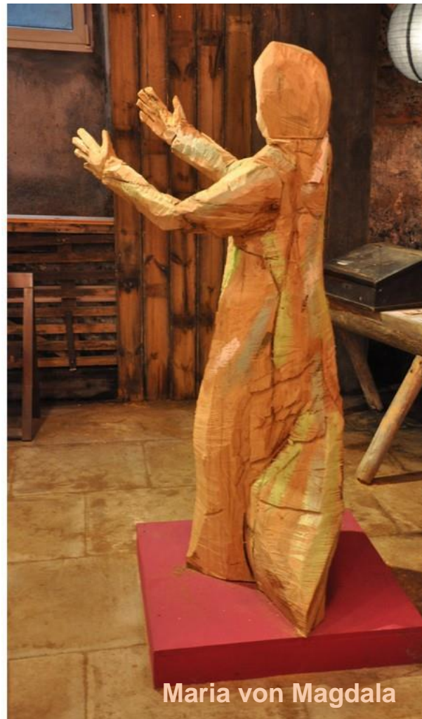
Maria von Magdala